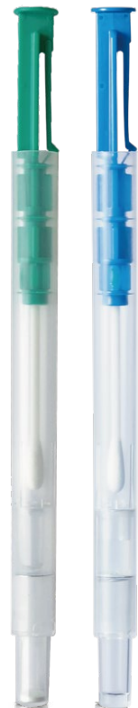
右)ルシパック A3 Surface (湿潤綿棒)