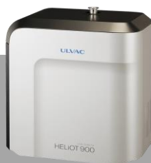
リークディテクタ