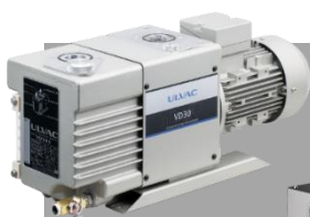
油回転真空ポンプ