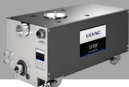
ドライ真空ポンプ